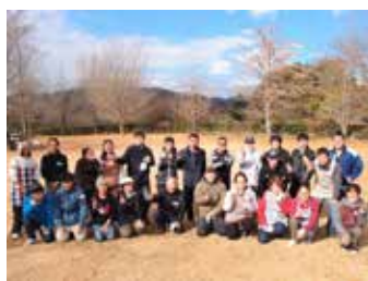
▲バーベキュー交流会