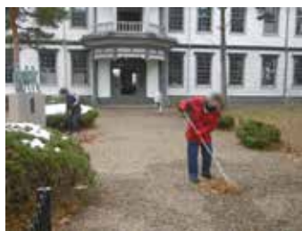
▲就労体験(安積歴史博物館)