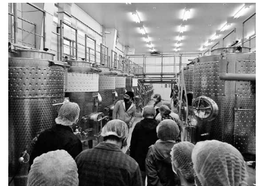
ふくしま逢瀬ワイナリーの見学