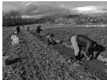
農作業体験(ニンジン収穫)